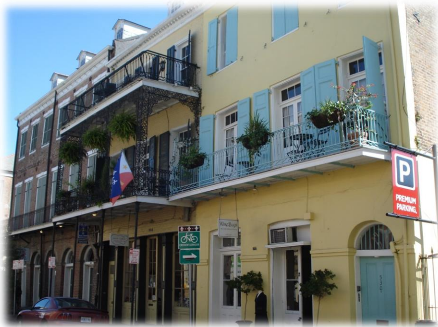
Strasse in New Orleans