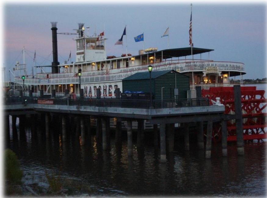
Raddampfer auf dem Mississippi